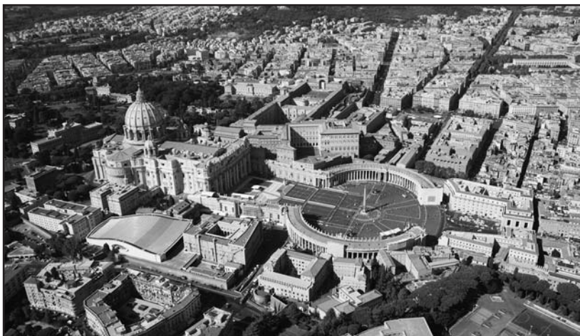
Una suggestiva visione della Cattedrale e della piazza S. Pietro.