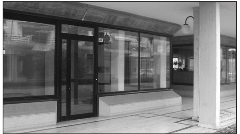
La nuova sede in via Paolo VI zona City.

Nuova sede per la Cisl a Montichiari aperta in questi giorni in Via Paolo VI al n. 44 nella zona della City. Una sede più ampia nei confronti delle precedenti, che vede poco distanti gli Uffici Comunali, oltre a quelli della Posta, servita anche da vari posteggi. Gli orari sono per ora invariati, più ampie aperture e la presenza di maggiori servizi