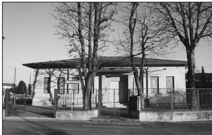
L'ex-scuola elementare dei Chiarini, ora in vendita.

La sera, a letto con le finestre aperte, continuavano nel pensiero gli echi della giornata, fra lunghe serenate di usignoli sugli alti olmi e il gorgoglio sommesso del Vaso Reale. Chiarini, insomma, aveva già allora qualche ambizione, destinata ad incontrarsi urbanisticamente con il capoluogo: aveva chiesa, asilo e scuola, e c'erano locali ad uso pubblico per merito di benefattori che avevano privilegiato la frazione con lasciti importanti. L'a-