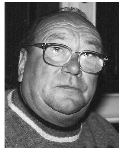
Sebastiano Zaltieri 3° anniversario