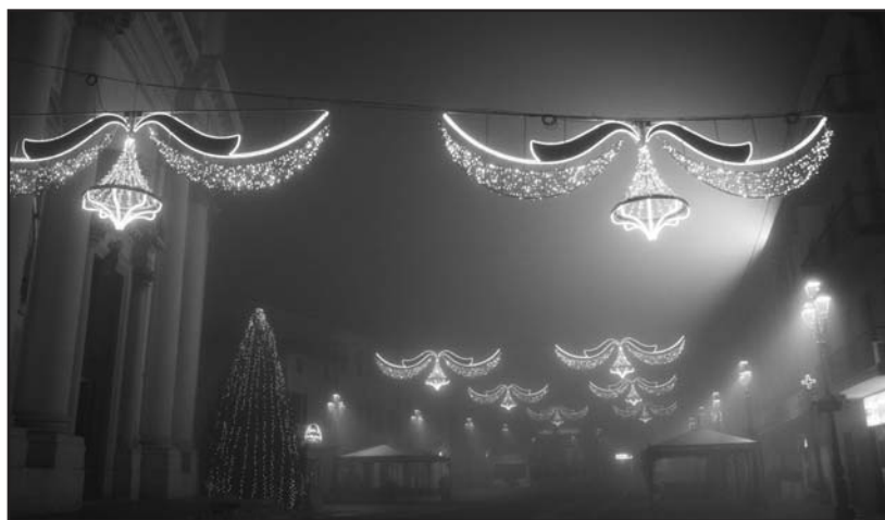
Un nebbioso Natale con i... baffi.

Ci piacerebbe che i lettori dedicassero attenzione agli articoli che denunciano manchevolezze e contraddizioni nella gestione della cosa pubblica (i pezzi di Bertoldo sono acuti capolavori di stile e di precisione informativa), e questo non è auspicio da poco: signi-