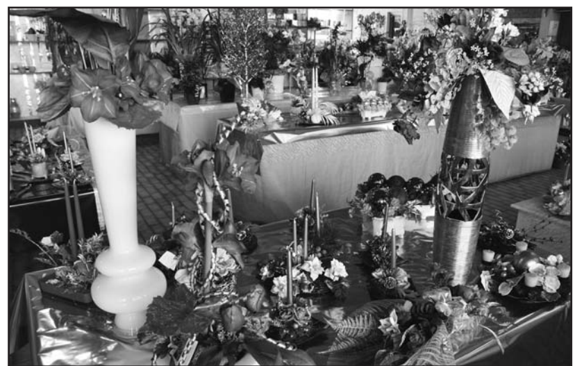
Regali floreali e addobbi di Natale al Garden Shop Pasini.

Ruggeri (Novagli) - Cipria e Candor - Il Bufalino - Forneria Podavini - Pasticceria Roffioli - Officina Ferrario. IMPORTANTE tutti coloro che hanno rinnovato l'abbonamento presso i punti indicati potranno, presentando il tagliando del rinnovo (valido anche il bollettino postale), recarsi al GARDEN SHOP PASINI a ritirare l'omaggio di una STELLA DI NATALE. L'iniziativa è valida fino al 23 dicembre 2013.