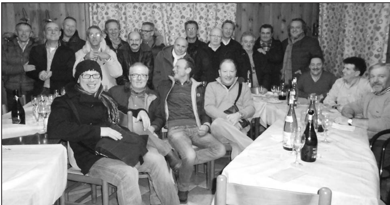
La compagnia si ritrova con i piedi sotto la tavola.

Sà som ritroacc per nà bè-la rimpatriada, sabot 30 noèmbèr, per meter i pè sota èl taol. L'era 'n pó che sà idiem mia, la solita solfa, èl laurà, j'mpegn, la famia e otre motivasiù. Isé sa som catacc al Bar Sole, doe da quac mes ghè nat só un nòs coscrit. Alura ghom ciapàt l'ocasiù dè fa la festa èn compagnia Le, ala tratoria al Sole.