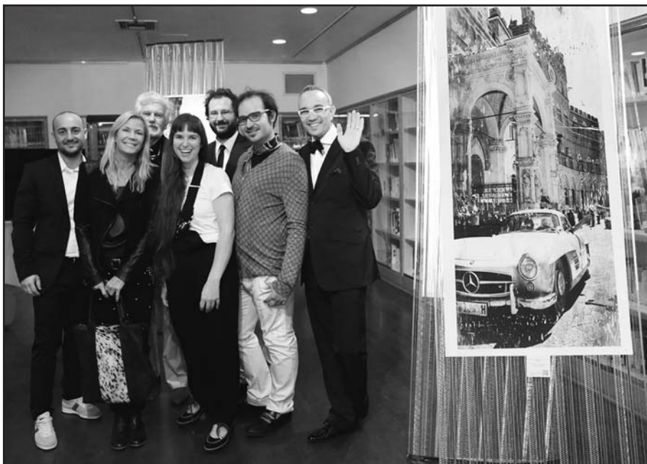
Foto di gruppo alla mostra di Los Angeles.